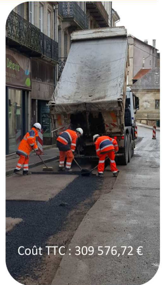
Coût TTC : 309 576,72 €

La rénovation de la partie laverie est en cours de réflexion.