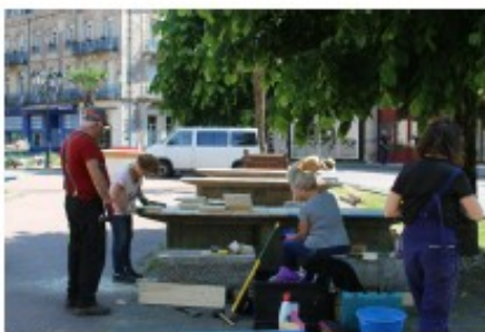
Aménagement transitoire de la Place Maurice Janot

CONTACT : Océane Jotrau 03 29 66 60 02 oceane.jotrau@plombieres.fr