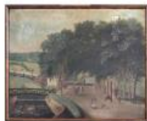
Tableau de la Petite Promenade - Musée Louis Français inv.267 - huile sur toile

C'est la Petite Promenade aujourd'hui Place Maurice Janot. Assurément note bon duc Stanislas, estimé de toute la Lorraine, surnommé « Stanislas le Bienfaisant » a transformé Plombières, l'embellissant pour accueillir au mieux dans notre ville ses petites filles. Durant leur séjour, il est venu leur rendre visite à plusieurs reprises. Il logeait au n°4 place du Bain Romain.