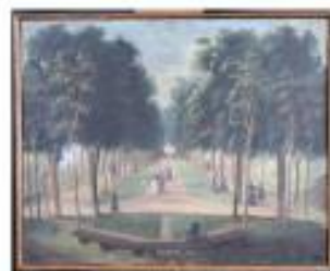
Tableau de la Promenade des Dames - Musée Louis Français inv.266 - huile sur toile

Cette huile sur toile provenant des collections du Musée Louis Français représente la Promenade des Dames.