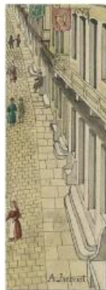
Aquarelle d'Amé Jacquot inv331

? Question du jour : Comment s'appelait à cette époque cette hostellerie ? ?