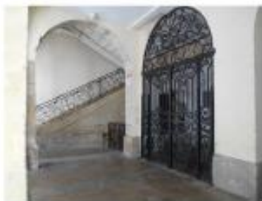
Photographie ferronneries Arcades