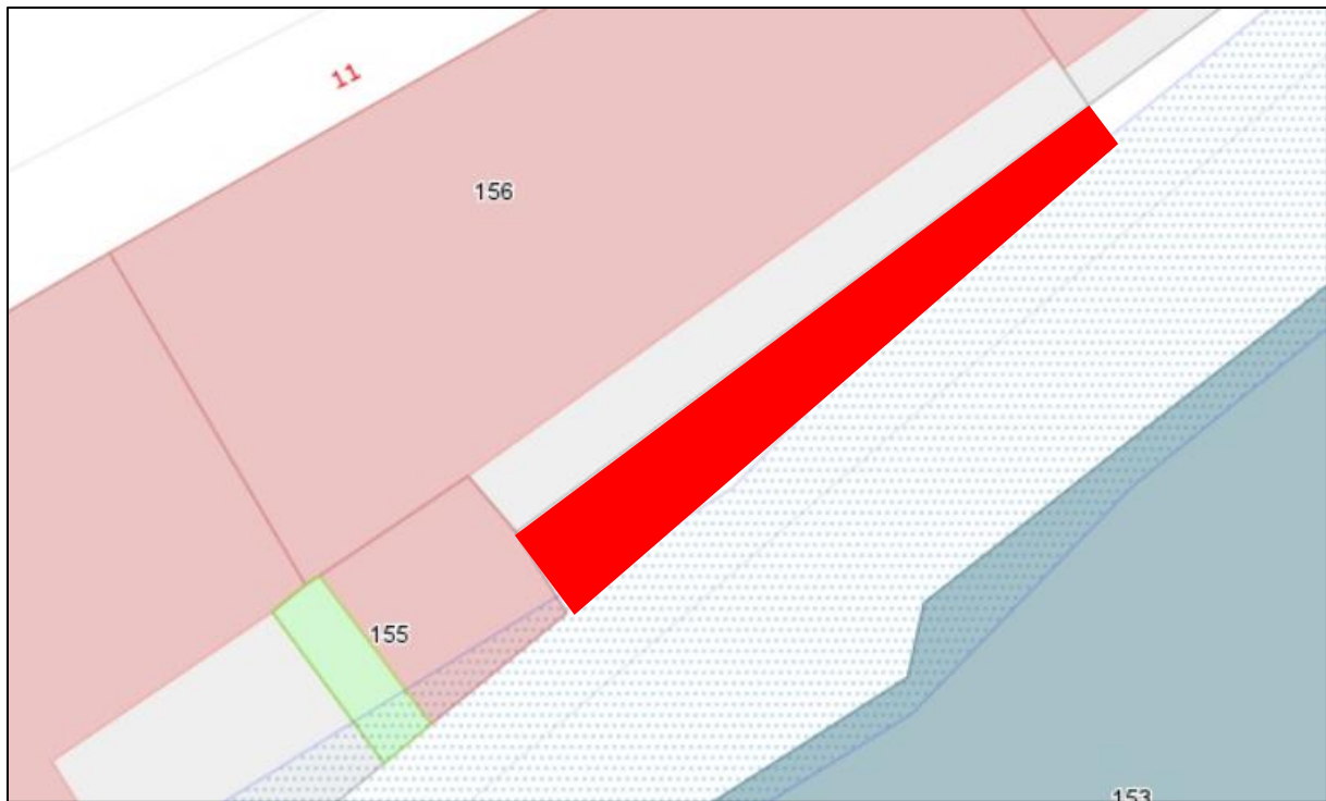
Plan de division pour déclassement